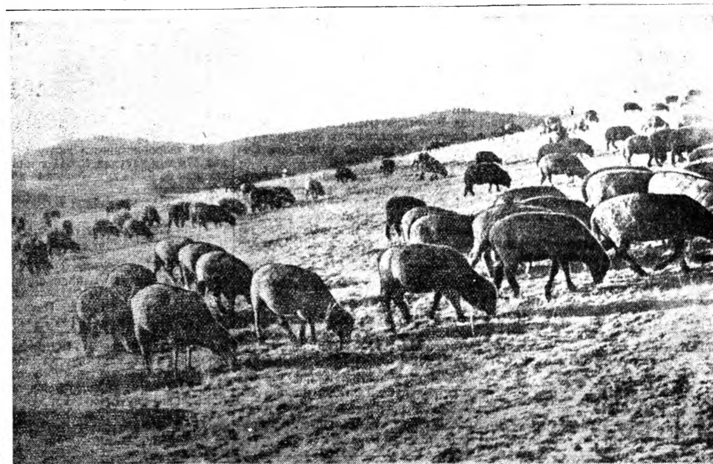
Сэлэнгын аймагай Сталиной нэрэмжэтэ колхоз үүдтэр ЗУРАГ ДЭЭРЭ: парибтар ноһотой үүдтэр хонд адууд- байнтай хонидые ошоор үсэхэрилнэ. гада ябана.

Шэнэ газар дээрһээ зарим кол- хозууд яһала һайн ургаса абаа. Жэ- шээхэдэ, Кабарский аймагай Ма- ленковой нэрэмжэтэ колхоз зуун гектар шэнэ газар дээрһээ га бү- рнн 18 центнер шэниснэ, 27 гектар дээрһээ га бүрнн 22 центнер өвсө. 14 гектар дээрһээ га бүрнн 29 центнер шэниснэ хуряагаа. Тингэжэ эндэхн Лениний нэрэмжэтэ колхозой нүүхэр Трещинковэй хүтэлбэрлэдэг таряанажалай бригада 236 гектар дээрһээ га бүрнн 17,4 центнер шэн- иснэ, 66 гектар дээрһээ га бүрнн 110 центнер зеденко хуряажа абаһан байһа. Яруунай аймагай Лениний нэрэмжэтэ колхоз 95 гектар шэнэ газар дээрһээ га бүрнн 20 центнер хара таряа хуряаба. Шэнэ газар дээрһээ үндэр ургаса хуряа ман жэһэнүүд аймаг бүхэндэ бии.