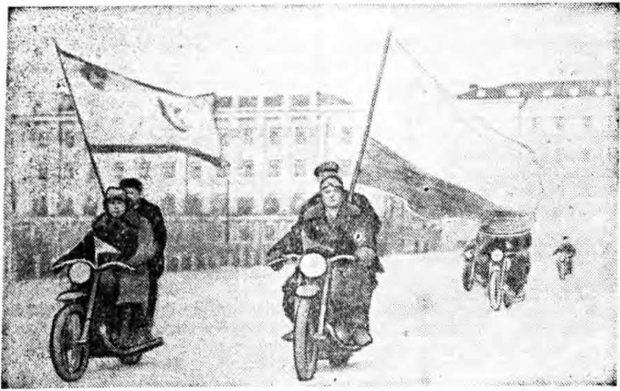
Агууехэ Октябрыска социалистическэ революциин 37 жэлэй ойе Улан-Удэдэ хайндэрлэлгэ.