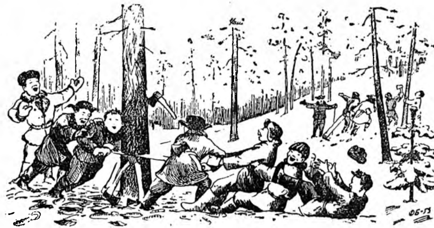
—Нэгэн, хоёр гурба-а! Татагы-ы-ы, саашань!!! —Нэгэн, хоёр, гурба-а! Түлхитгы-ы-ы, саашань!!! Ф. Балдаевай зураг.