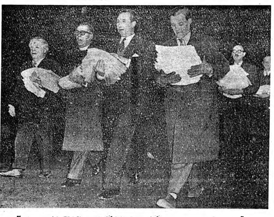
Хүн зоние олоор хюдаха зэбсэг хорихыг Англин олониттэ эринэ. Водородно бомбыг хорихын түлөө тэмсэлдэ Национална комитедэй түлөөлэгшэдэй депутаци 500 мянган хунай гар табихан бэмгэе премьер-министртэ наяхан зытгээгэ. Хүн зоние олоор хюдаха зэбсэгыг хорихо тухай асуудалаар СССР-эй, США-гэй ба Англин хүтэбэрилэгшэдэй зүблөө зарлах тулаа дары үүсхэл гаргахыг англайскэ правительство энэ бэмгэ соо уралагдана.

Адрес редакци: г. Улан-Удэ ул. Ленинна, 26. Телефоны редакци: редактора — 46-32, заместителя редактора — 32-74, отв. секретаря — 27-37, партийной жизни, сельского хозяйства — 47-59, пропаганды и переводов — 31-48, культуры и быта, промышленности — 35-11, местной информации и писем — 24-74. Для междугородных переговоров — 16.