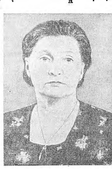
байнат, —гээд, хоёр нодэндэнь нэгэнэ дунал эм дунаажархна. Тэрээннээ хойшо үдэр һуни үшгэржэ байба. Жаркова болыннда эмшлүүлжэ хэбтэхэ зуураа, «халаг даа! Харгыгаанье бүдэг бадаг хараха болоо наа, яагаанье эхэ зол нааб!» гэжэ болоно.

1928 оной намар Закаменай аймагай центрэ үнэгэн яхатай дэлгэйтэй, үндэр һүмэтэй туйадай, залуу эхэнэр бин болобо.