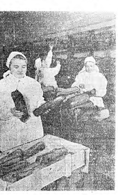
Астрахань. Дойто-Каспийска краесорьна комбинатад коллективн жэлннэгэ түсэбһе декабрин ахээр дүүргээд, эрхич сортын 22.000 центнер заганынай продукци гүрэндэ түсэбһөө гадуур үйлдбэрлэхэ байна.