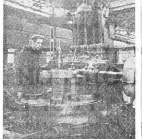
Москва. «Подъёмник» гэжэ заводой коллектив табиха табилжалыгтэ тусамба болзорһоон урд дүүргэһин түлөө мурьсэна.