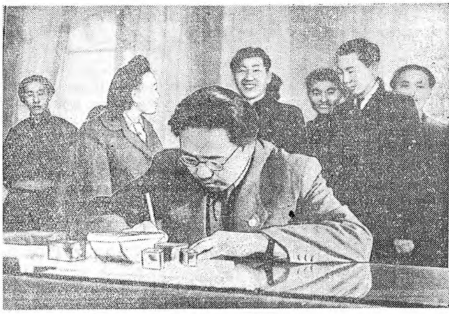
Атомна дайнда бэлдхэлгэдэ эсэргүүсэхэ уряалан Эб найрамдалай Бүхэдэлхэй Советэй Вьорогой хандан Хандагада Монгол Ардаай Республикда гар табигдажа байна.