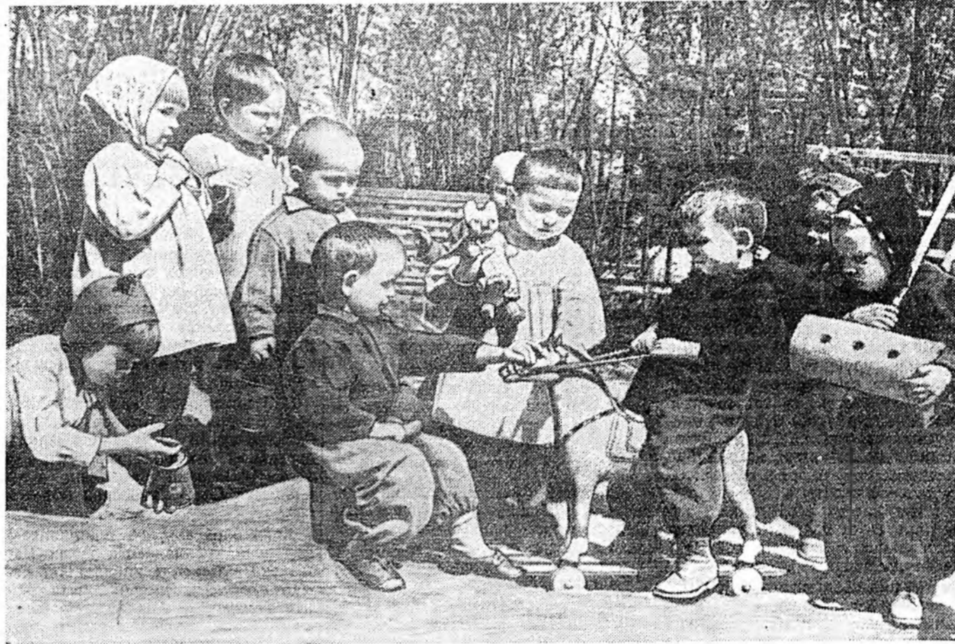
БУРАГ ДЭЭРЭ: Улан-Удэ городской улан аймай хүдэлмэриншадэй хүүгэдэй 26-дахн садай үхибүүд хабарай паранай дунда Улан элиэдэ сэнгэжэ, наадажа байна.