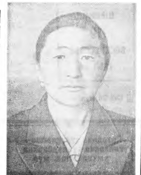
Һаяхан хаалишад, мал адуулагшад, фермэнуудыг даа- ганарай республиканска үзбөөн бодожэ үнгэрөө. Һү хаал- гыг, мяха абалгыг дээшлүүлхэ гэжэ үзбөөндэ хабадагшад республикын бүхү хаалишад, мал адуулагшад хандаһан хандагша баталан абаа.

Партиин болон ажахын эдэбхи- тэдэй суглаан малажалһаа ашаг шэмэ абалгыг энэ жэлдэ эрид дээ- шлүүлхэр хараалаһн дэлгэрэнгыг шийдхэбэри баталан абаба.