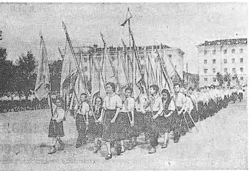
ЗУРАГ ДЭЭРЭ: Пионерүүдэй республиканска слёдо хабаадагшарай А. Мангаевай фото.

Зүблөөн болбол коммунистуудай политическэ хуралсалай шанарыг, идеинэ удхыг дээшлүүлхэ, ажабай-далтай, түрүү дүй дүршэл пропаган-далгатай тэрэнэй холбоо барисаа удам үргэдхэхэ шухала гэжэ тэм-длэе.