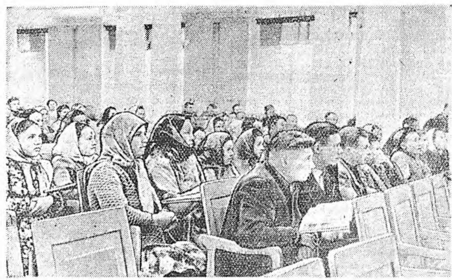
ЗУРАГ ДЭЭРЭ: гахай үсхэбэрилгын түрүүшүүлэй республиканска зүблөнэй заседаниин зал соо.

Эртин урягаар кол- боор эгсэ 5 нара боллооб. Аман гахайдаше бэшэ, мүн тэн- хүүдэмэрлэжэ байган хү- ршэлы колхозой хүгэлбэрилгэ- анхарал багатайгаар хандадаг А. Колхозой парторганизаци шадтай дунда нинтэ-политиче- гүдэмэри ябууддаггүй. Харин өө оролдохын хүсөөр улаан бу- ай боложо, газетэ, журналар