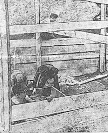
Ждановой нэрэмжэтэ колхоз (Бичура) 100—100 тонно силоснэ багтааха 21 нүхэ малтаха юм. Мүнөө 13 нүхэн энэ хүдэлмэридэ МВЛ-гэй аймагай таһагай гэгнэ.

ЗУРАГ ДЭЭРЭ: шефүүд силоснэ нүхэ цементээр ханалаһаа түхээржэ байна.