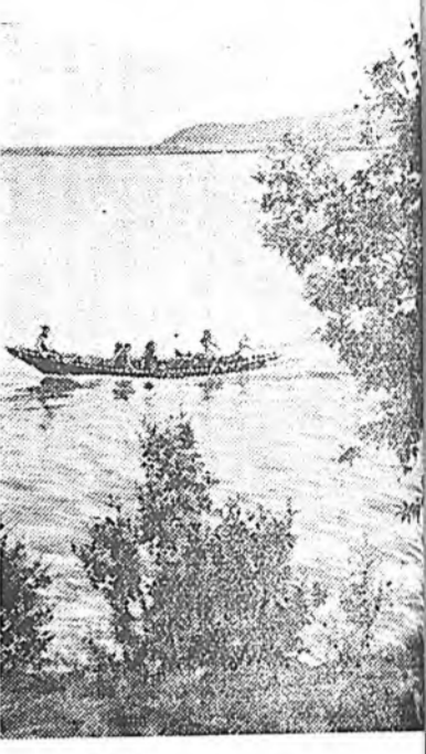
Сурхайта нуур дээрэ.

Советскэ делегаци элдэб оронуудай Японини, Индини, Латинска Америкын оронуудай, Дүтын ба Дуида Востогой, Африкын оронуудай делегацинуудай гэршүүдые конгрестхэ сэхэ Москва ерэхыенэ уриан байна. Элэ делегацинуудай гэршүүд тэрэ уряалы хүлээгэ.