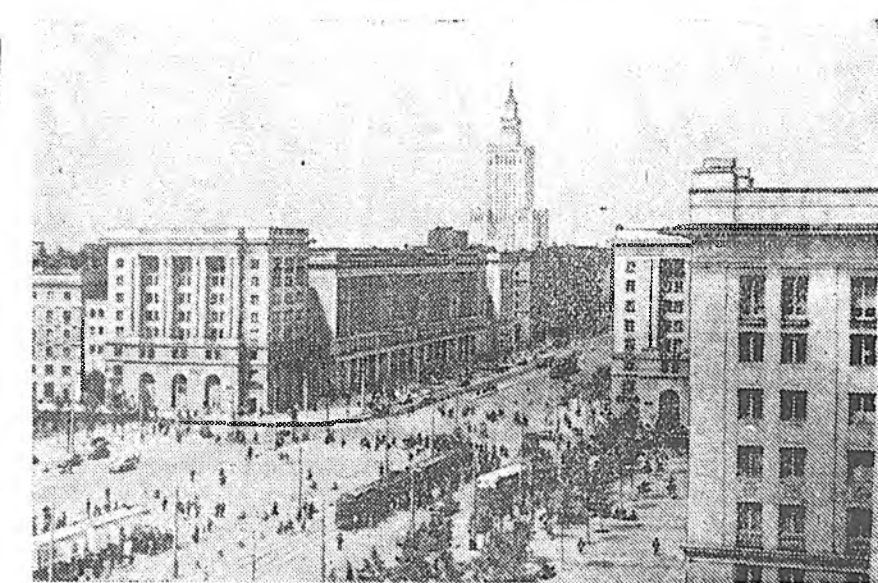
Польско Арадай Республика. Варшава городой Конституциин Талмай.

Советскэ Союз дотор уулзажа хөөрлөгдөн хүнүүднэй жаргалтайбди гэжэ манда хэлэдэг байгаа, тездэше тэдэнэр нэрээһээ жаргалтай гэжэ индийскэ делегациин гешүүдэй нэгэн хэлбэ.