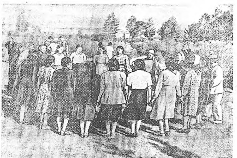
ЗУРАГ ДЭЭРЭ: колхозой залуушуул хүхюун зугаатайгаар бохор хатарна.