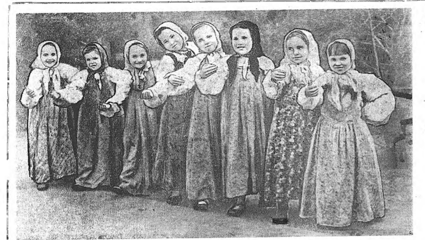
Кяхтын аймагай Маленковой нэрэмжэтэ колхоздо байһан болоһон Малшадай үдэртэ аймагай Пионерүүдэй ордной хүүгэд ерэжэ концерт тайба.

Франс Пресс агентствын дамжууланай ёһор, Женевскэ зүблөөнэй амжалтагайгаар үнгрлэнэй дашрамдуулан Франциин министрүүдэй совет Фор Пинэ хоёрыс амаршалһан байна.