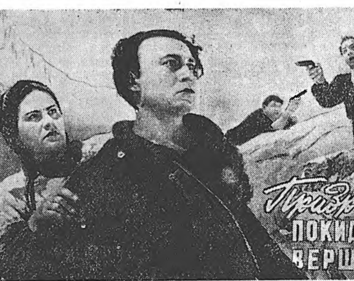
гэжэ уранһайханай шэнэ фильмы һаяа харууланхэ.

Энэ фильмы Ереванска киностуди буулгаа, 1955 он