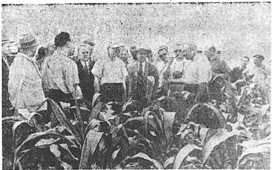
Америкийн Холбоото Штатуудай хүдөө аж ахуйн делегаци Советскэ Союз дотор аяншалга хэнэ. Делегаци хадаа Харьковский гурнай селекционно станцида хүрэн байна.