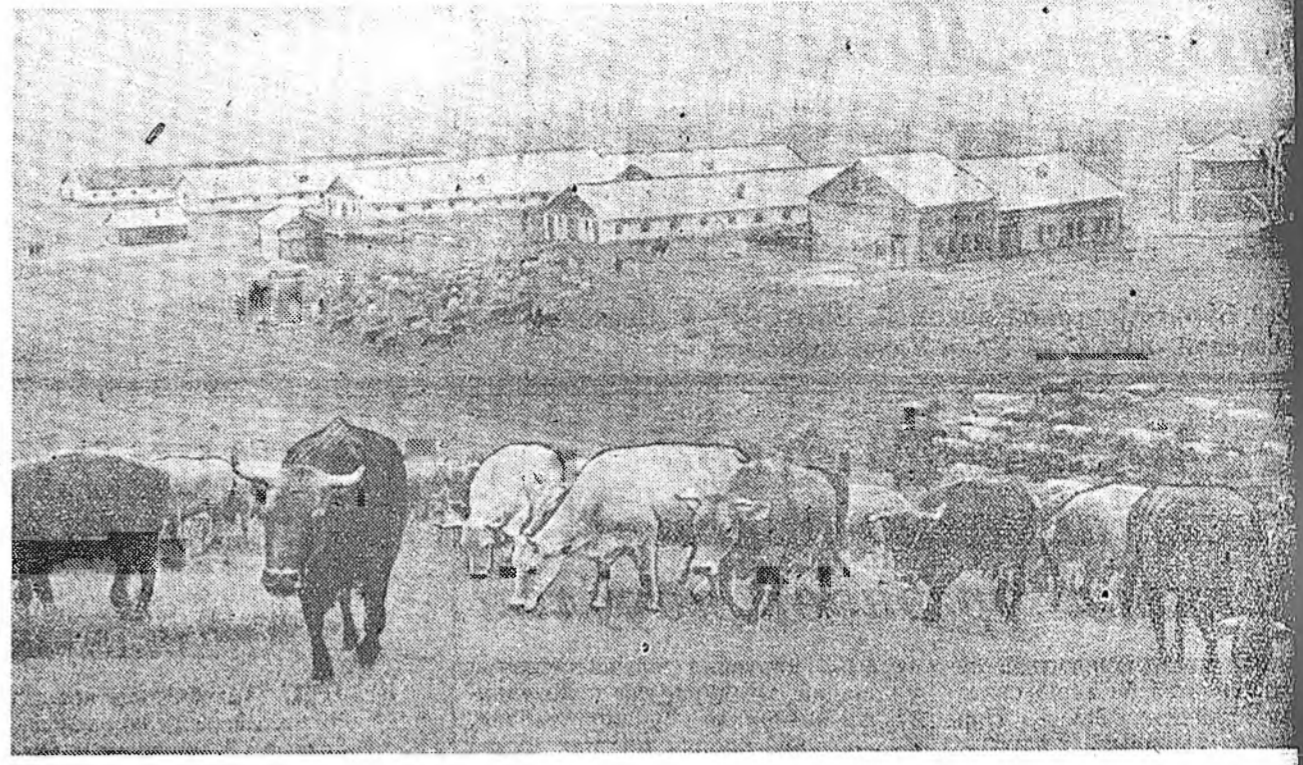
Ниргизскэ ССР. Пльичын нэрэмжэтэ үүлтэртэ малай совхоз (Фрузенска област) алаусака үүлтэртэй эбэртэ бодо малай тоо толгойе жал ерэхэ тудам олон болгоно, ашаг шамэ уялгынь дээшэлүүлнэ. Үнгэртэжэ жэлдэ үнээн бүриһөө 5.072 килограмм һу һааһан байна.