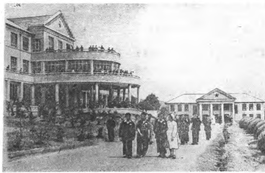
Хитадай Арадай Республика. Куйбын город шадар нуурай эрье дээрэ гоё байхан газарта санатори хаяхан нээгдээ. Танда 250 хүн амарха юм. ЗУРАГ ДЭЭРЭ: санаторин парк соо амарашад байна.