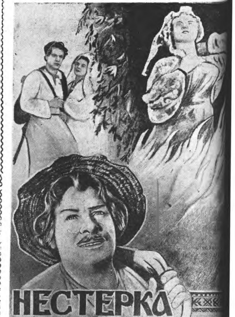
НЕСТЕРКА гэжэ ураннайханай шэнэ фильм харуулагдажа „Беларусьфильм“ гэжэ киностуди 1955 ондо буулгагдана.