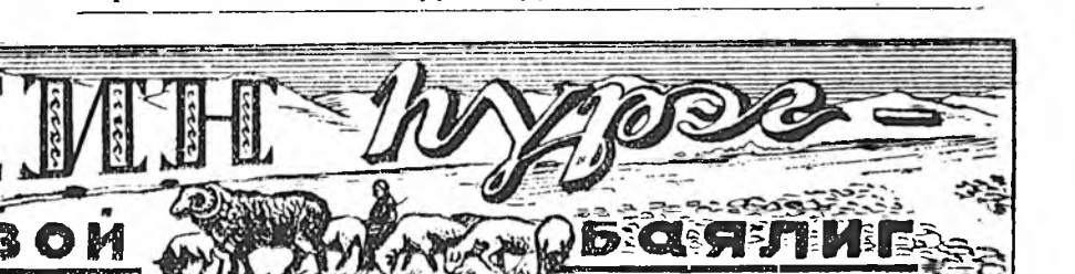
(Хэжэньгын аймагай «Коммунизм» колхозноо ерһэн бэшэ)