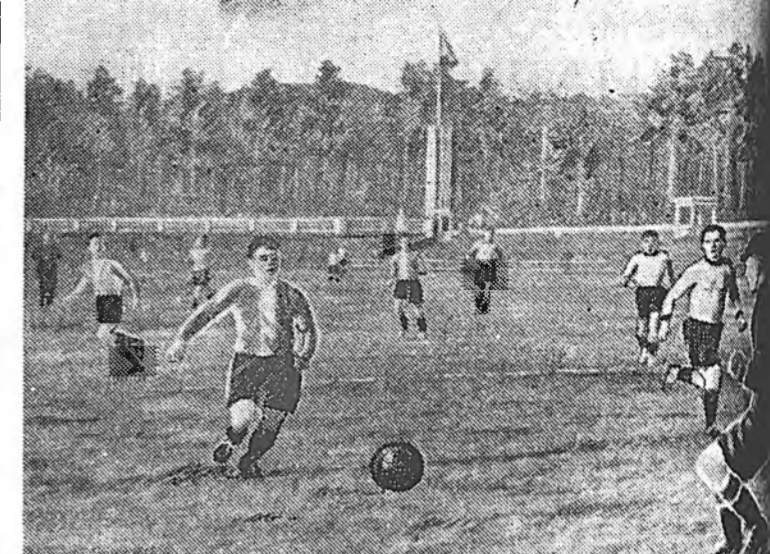
БМАССР-эй 25 жэлэй ойн нэрэмжэтэ стадион дээрэ обшпрофсоведийн тудоо «Байкал» (Улан-Удэ) «Металлург» (Городок) хоёрой тоһоно уулзалга августын 31-дэ болобо. Улан-удынхид 3:0 тоотойгоор ниние илаба.

ЛОНДОН, сентябрьн 1. (ТАСС). Һүүлэй нара соо Ангида юумэнэй сэн гурбадахла нэмэбэ гэгшэн мэдээсэлые «Ньюс-Кроникл» газетэ тунхаглаба. Орон дотор юумэнэй үнэ сэн ходо дээшлэжэ байна гэжэ тэмдэглэхэ зуураа, үргэн хэрэглэлэй зарим эд бараанай үнэ сэн намар гэшэе үшөө дээшлэхэ байха гэжэ газетэ бэшэнэ. Тэрэ тоодо зарим нэгэн эдэе хоолой товарнууд, жэшээлхэдэ, тоһон оролсохо байна.