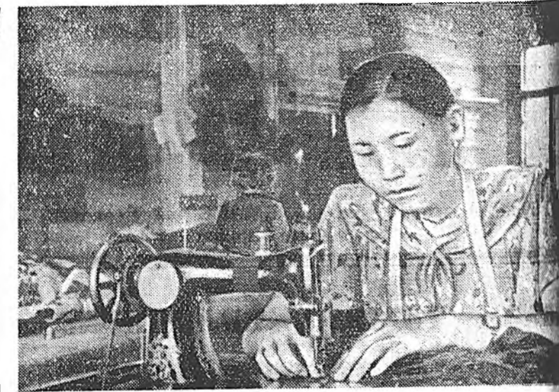
Улан-Удын олоборилгын «Труд» гэжэ артелинихид табиха табигданан механизмууд үндэр дээдэ техникы гэршэлжэ үгэнэ. Советскэ мэдээжэ мэргэжлэтэ эпэнэ тушаа ингэжэ хэлбэ: — Ямаршэ гүрэнэй инженернууд эндэхэ өөртөө ашатай тунатай олон юумые ойлгожо абаха байна.

Чехословакиин арадай культурын, эрдэм гэгээрэлэй, наукин, элүүрые хамгаалгын, спортын хүгжэлтые харуулан павильон соохн экспонадууд тон эхэ һонирхолтой.