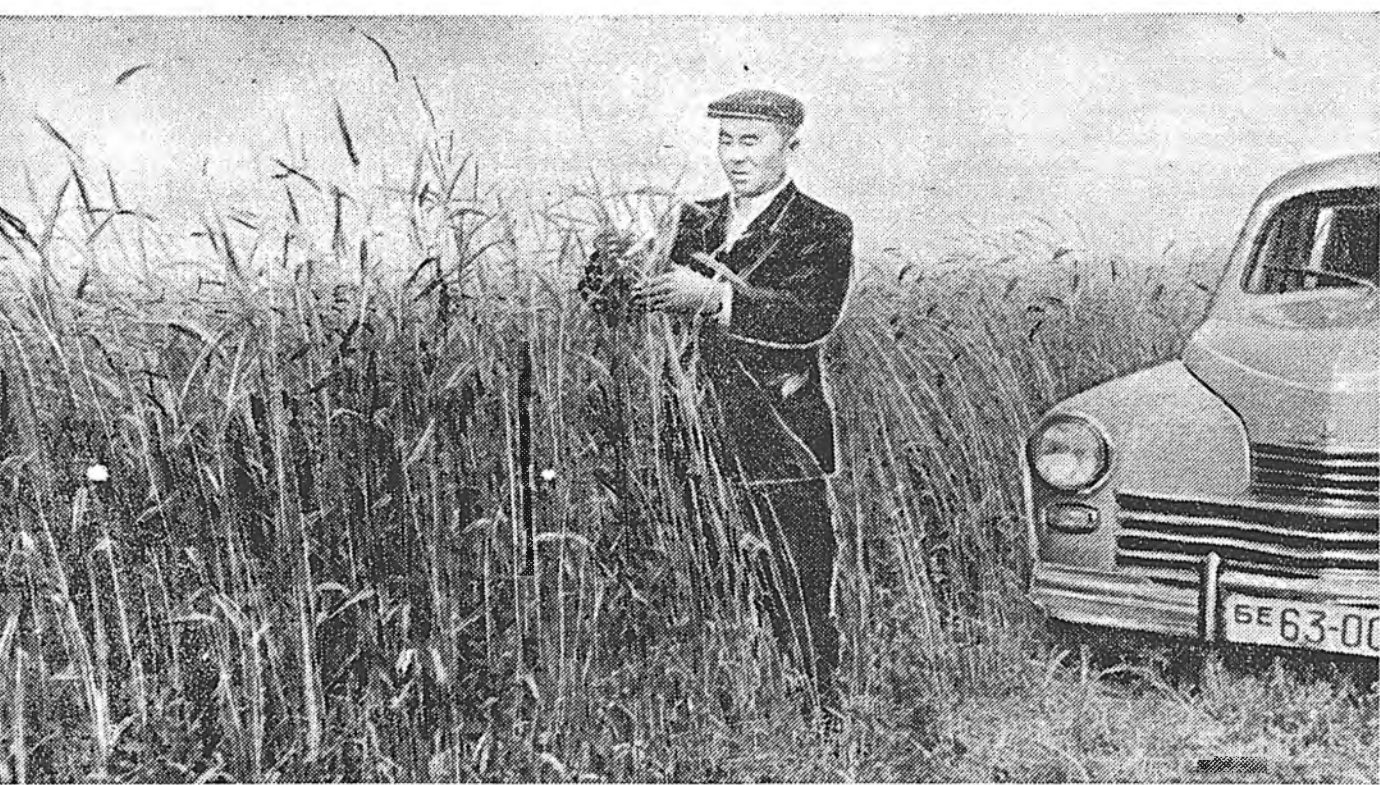
Энэ жэлдэ Хэжэнгын аймагай «Коммунизм» колхозой гэгшэд Чесанын МТС-эй механизаторнуудтай хамта оролдосо-тойгоор ажаллажа, таряанай баян ургаса ургуулаа. Колхоз тарилгынгаа талмайн га бүриһөө дунда зэргээр 12 центнер-һөө доошо башэ ургаса хуряаһаар хараална.

СССР-эй Оборонын Министрын ПРИКАЗ... Москва город. 1955 сентябрийн 6. № 50. Тогтоогдомол болзороо дүүргэнэн сэрэгэй алба тухай СССР-эй Зэбсэгтэ Хүсэнүүдхээ табиха тухай, уялгата албанда ээлжээтэ таталга үнгэргэхэ тухай бүтээнитгын уялга тухай Хуулнтай зохиһуулан нингэжэ уялгата албанай Хууляар тогтоогдомол болзорые дүүргэ-нууд, матросууд, сержантууд болон старшинуудые Советскэ Далайн-Сэрэгэй Флотой, хилэ шадарай ба дотоодын сэрэгүүдэй элэ залас болгон табиха. Приказай I п. дотор заагданан сэрэгэй алба хөгшэдые таби-шарамдуулач, сэрэгэй уялгата алба хэдын тулада 1936 ондо ал, таталгана хүнгэлэгдэхэ ба хойшолуулагдаха эрхгүй хү-нүүдые, мүн тэрэнэлэн таталганаа хойшолуулагдаһан болзо-рон ба сасуутанайн сэрэгэй уялгата алба хэжэ байһан татал-гай гражданинуудые Советскэ Армида, Далайн-Сэрэгэй Флото, арбай ба дотоодын сэрэгүүдтэ абаха. Далайны сэрэгтэ ба матросууд, эскадронуудта, батареинүүдтэ, эскад-рые бүхэ ротонуудта, эскадронуудта, батареинүүдтэ, эскад-рые кораблынууд дээрэ сонсохсо. Оборонын Министр Советскэ Союзай Маршал Г. ЖУКОВ.