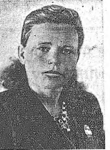
Имэһеэ бидэнэр, тэмэрэмшад энэ транспорт дээрэ техническэ дэбжэлтэ туйлахын, шэнэ технологи хэрэглэн, ашаа шэрэлгыс дээшлүүлхын түлөө бүхы хүсээ элсүүлэхэ ёһотойбди.

нууд, шүрбүүд байдаг. Париманийн һуладана, күрланыше байдаг.