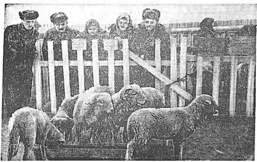
Сэлэнгын аймагтай XVIII партсездын нэрэмжит колхозой хонишод үбэл, харбар эрт хонидоо олоор хурьгалууддаг болохой. Эрт гарахан хурьгадны оройн хурьгада орхдоо хураггүй төмөшье, нооно ехье үгэдэгшье байна.