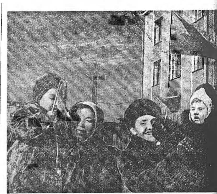
НАЙДЭЭРЭЙ ҮГЛӨӨГҮҮР.

НЬЮ-ЙОРК, ноябрийн 5. (ТАСС). Ассошиэтед Пресс агентствын корреспондентын мэдээһэнэй ёһоор, үсэгдлэр Египетдэй правительство Суданай бөө даанхай болохо ябадалай хойноо ажаглан хаража байха уласхоорондын комиссида оролсохо ёһотой болоһон долоон гүрэндэ ното эльгэбэ. Энэ ното дотор Египет болбол Суданай ерээдүйн статусые тодорхойлохо арга тухай асуудал тушаа шиндэхэбэрине удаа-уралжа байна гэжэ Англие гэмнэнэ.