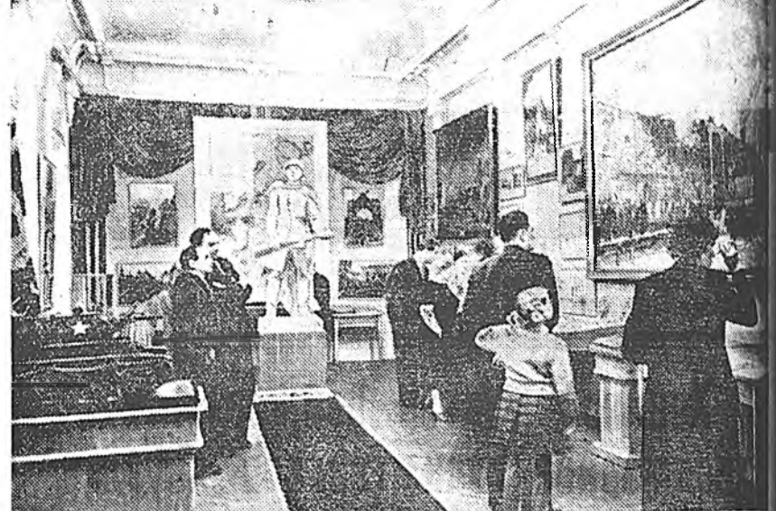
ЛЕНИНГРАД. Ленинградтай түүхын музейгээдэ. Городой тогтоһонһоо элэ шонхи хоёр зуун табин жэлэй түүхэ музейи арба найман зал соо харуулагдаг. Городой урдын революцион түүхэ, Эсэгэ ороноо хамгаалгын Агууехэ дайнай үргэнөөр харуулагданахэй. ЗУРАГ ДЭЭРЭ: Эсэгэ ороноо хамгаалгын Агууехэ дайнай үедэ харуулан зал соо хүнүүд ороод байна.