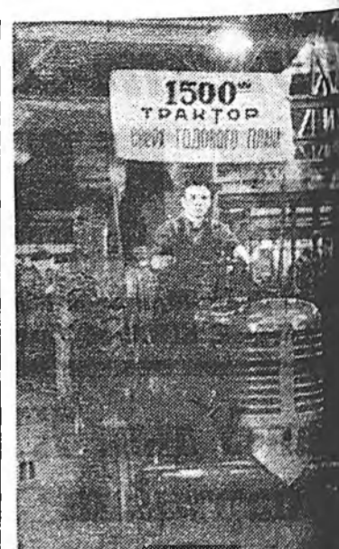
Харьнов. КПСС-эй ЦК-гэй тухай Пленумтай тогтоолодо харуу болгоо аасэс хуртат тусабһөө гадур «1500» маркын 1500 трактор бүтээгэ түрэгэ гэжэ трактор хабсаргалын заводтай лектив уялга абаһан байгаа. Тухай лектив уялгага болзоһоонь һара урхид дүүргэе. ЗУРАГ ДЭЭРЭ: 1500-дахи трактор заводтай главна конвейерһээ тухай абаһа.

ёһоор 1948 ондо тус корпораци байгуулагдаһан юм. Асансол аэродром дээрэ Н. А. Булганиниие, Н. С. Хрущевые баяр ёһололой оршон байдалда угтаа. Тэдэниие угтахын тулада индийскэ правительствын түлөөлэгшэ промышленностини министр Н. Канунго, Баруун Бенгали штатай тухай дээдэ тушаалтай хүнүүд главна министр Рой түрүүтэйгээр эндэ ерээ. Дамодар гүрэнэй гол шадарай нуга газарнуудай хэдэн олон мянган ажалалд аэродром шадар сугларжа, советскэ айлшадые хани ёһоор амаршална. Н. А. Булганин, Н. С. Хрущев автомашинуудтаа нуугаад, аэродромһоо сэээ Читтараджан ороо. Гүрэнэй паровозо бүтээлгын орон доторхи эгээн томо завод тэндэ байдаг юм. Мүн тэрэндэ дүтшэт Дамодар мүнхэнэй шадарай нуга газарта эгээн томо плотина (хаалта)—Барахар мүнхэн дээрхи Майтхон гэжэ плотина баригдажа байн