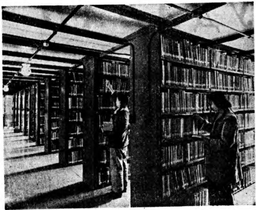
Хятадай Арадай Республика. Пекинскэ гүрэнэй библиотекэ республика соохи агзан томо библиотекэ болоно. Энэ библиотекэ дүшэн янзын хаан дээрэ хэблэгдэһэн дүрбэ миллион үдүүтэй номтой юм.