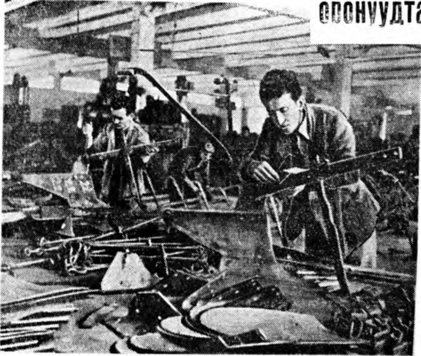
Албанин Арадай Республикын хүдөө ажлахи 1955 ондо урда жэлэхиде орходо хоёр хахад дахин слон плуг абаа. ЗУРАГ ДЭЭРЭ: Тиранадахи механическа заводой дехтэ бүтээгдэһэн шинэ түхэлэй плугууд харуулагдана.