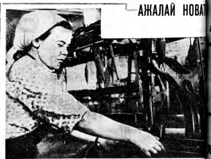
Уласхоордын ажалладай найндэр—Майн 1-нэй хүндэлдэ социалистическэ мурисөөн үргэн далайсагайгаар дэлгэрбэ. Улан-Удын эмбйан фабрикын хүдэлмэришэд тус мурисөөндэ эдэбхитэйгээр оролсо. Ажалай новатор Евдо-

Хитадай талаана Хитадай Ардай Республикын Гүрэнэй советэй премьер Чжоу Эн-лай, премьерэй орлогшонор Чэн Юнь, Пын Дэ-хуй, Дэн Сяо-пин, Дэн Дэ-хуй, Хэ Луи, Уланфу, Ли Сянь-нин, КНР-эй гүрэнэй бусад ажал-ябуулагшад хэлсээнүүдтэ гар табилгын үэдэ байлса.