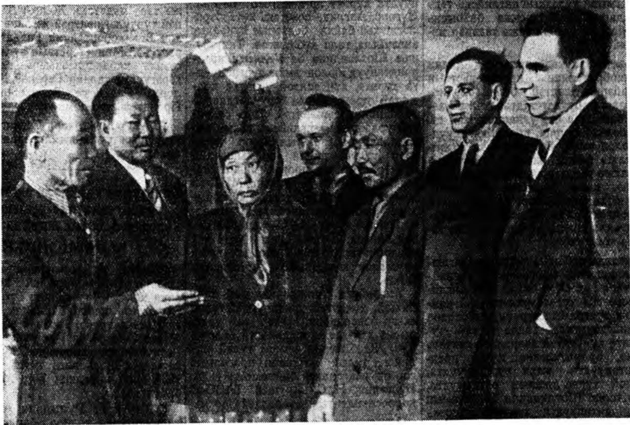
— Манай үргэн элдин тала дайда хониде, плангала нари ба нарибтар нооһотой хониде олоор үсөөбарилгара эхал тааралжагтай даа гээд Агын хоняһомой хөлөхөдөн. — Манайше Бургалтай хонидой хэдэн мянгадаараа бэлэжэ ябаха тала дайда бии, ногоонинь һайн гээд Ториин хоншон хоорэнэ.