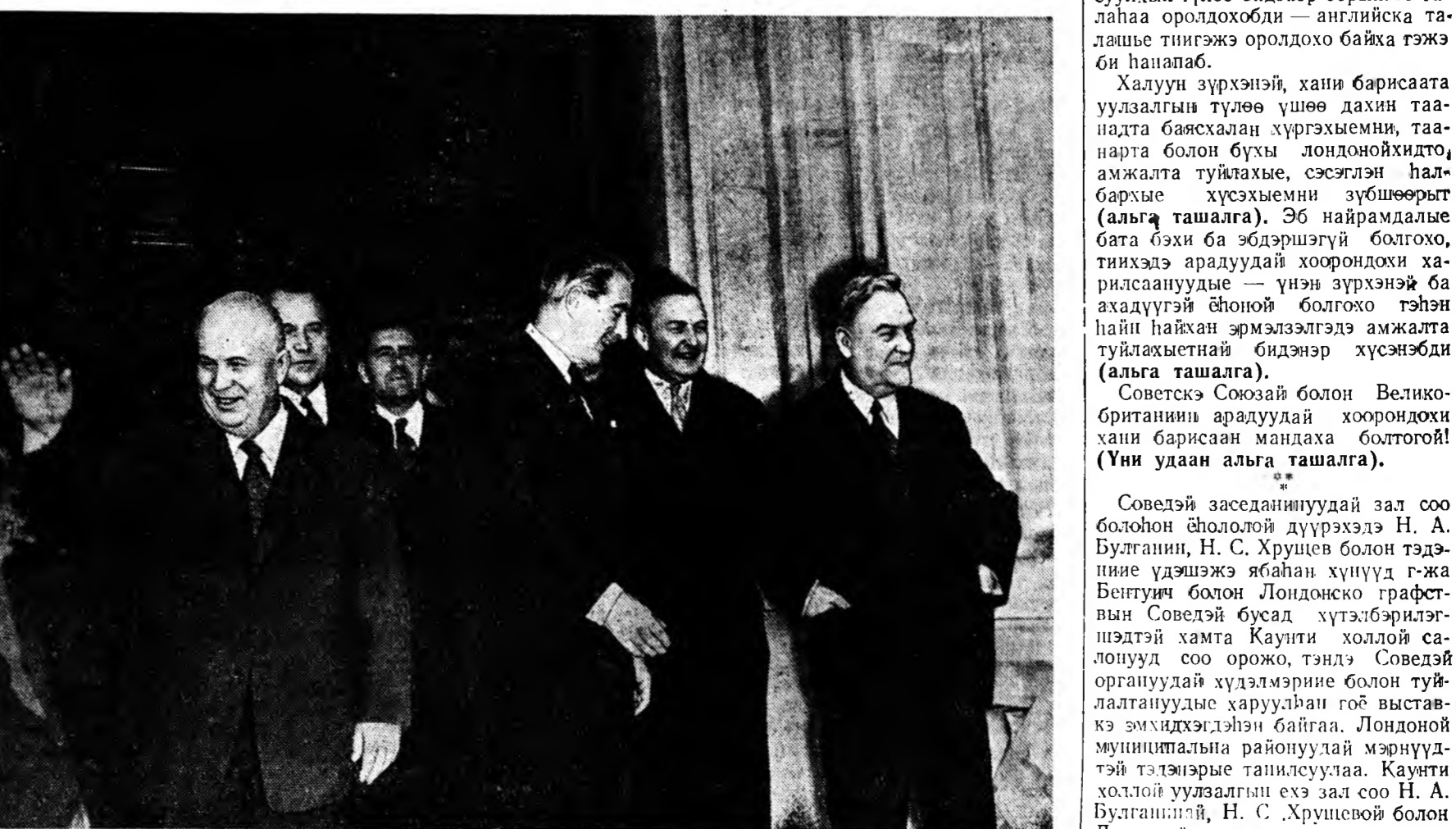
СССР-эй Министруудэй Советдэй Түрүүлэгшэ Н. А. Булганин, СССР-эй Верховно Советдэй Президиумэй Гүшүүн Н. С. Хрущевой Англида ошоод байн тухай

ЗУРАГ ДЭЭРЭ: Н. С. Хрущев, А. Иден, Селвин Ллойд, Н. А. Булганин советскэ посольстводо байна. ТАСС-эй фотохронини.