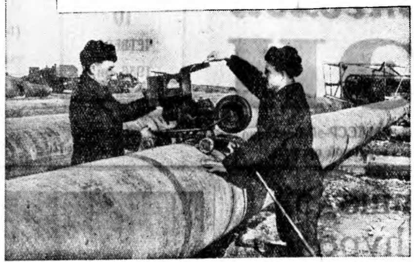
ЗУРАГУУД ДЭЭРЭ: (зүүн гарһаа) 1. Агрегаттай түүрүшын монтаж харуулагдана...