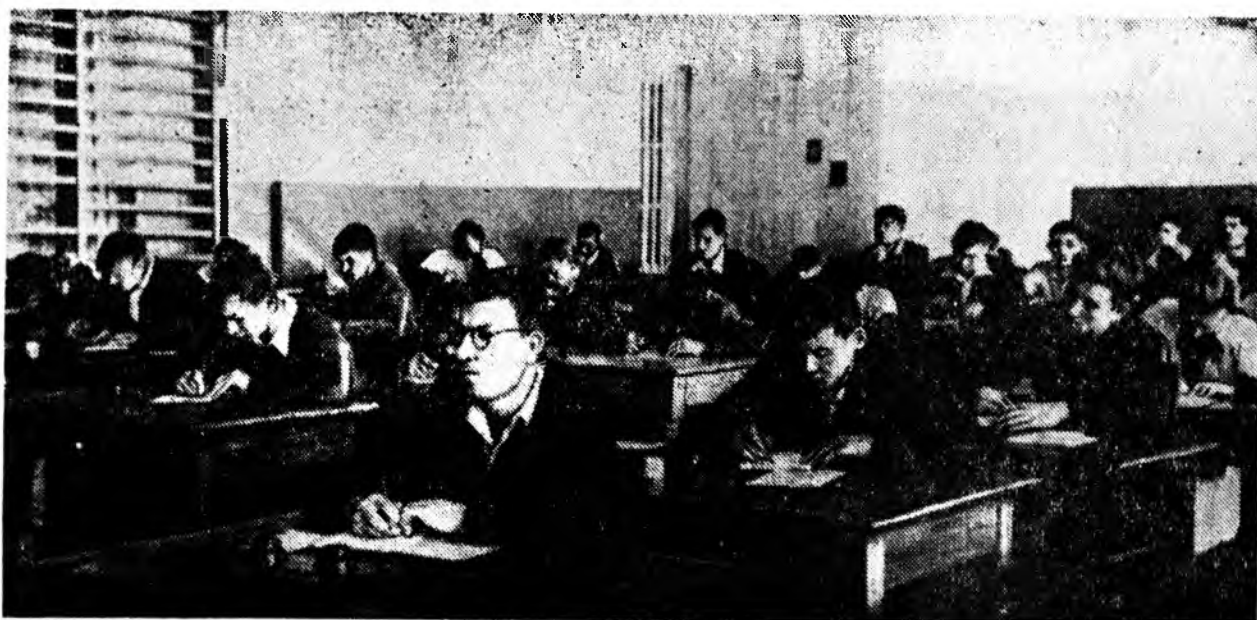
ЗУРАГ ДЭЭРЭ: Улан-Удын № 1 дунда нургуулин 10-дахи «А», «Б» классайхид түрүүшын экзаменда литературсар сочинени бэшэжэ байна.