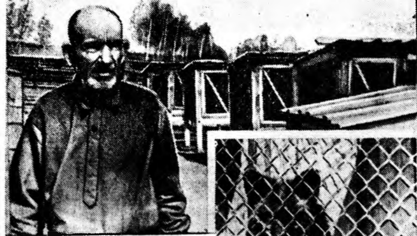
Түсэбэй ёһоор энэ фермэ үнгэнэ бүринөө 3 гүлгэ абаха наа, мүнөө 3,8 гүлгэ абаад байна...