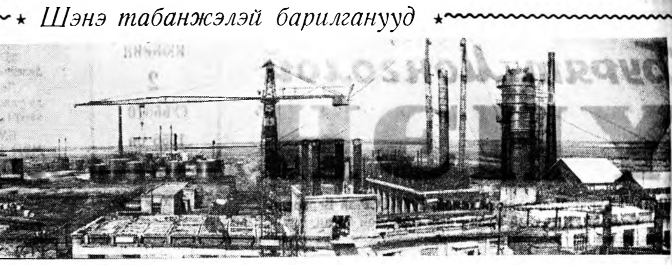
Молотов. Орон доторхи эгээн томо заводудай нэгэн болдош Молотовскэ нефть шарнажуудлаг завод зургаадахн табанжэлдэ ашаглалгада үгтэхэ юм. Зарим барилгануудынь 1957 оной ахээр бэлэн болохо.