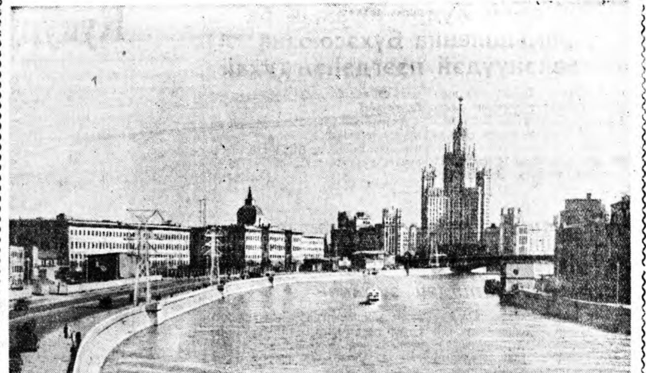
Москва. Москворецкэ хүүргэ дээрлээ Москва гол ташы харахада нима байдаг.