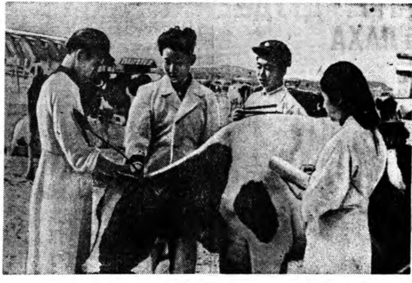
Корейск Арадай-Демократическа Республикада арадай гэгээрэл түргөөрө уранзохоболшо Максим Горькийн наһа бараһанһаа хойшо хорин жэлэй ойе тэмдэглэхэ зуураа, мүнөөдөр уранзохоболшын ажабайдал болон зохёолдо зориулалтан, хитад литературын хүгжэлтэдэ тэрэнэй зохёолой нүдөөһөн тухай олон тоото статьянуудые толилоо. Максим Горькийн ажа-ябадал тухай ехэ интрионүүд болон стендүүд, плакандууд болон фотоурагууд Пекинэй талмайнууд болон паркунда табигдаа.