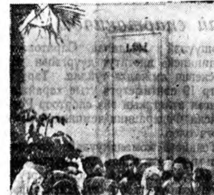
Москва. 1956 оной Бүхэсоюзна хүдөө ажарын выставка.