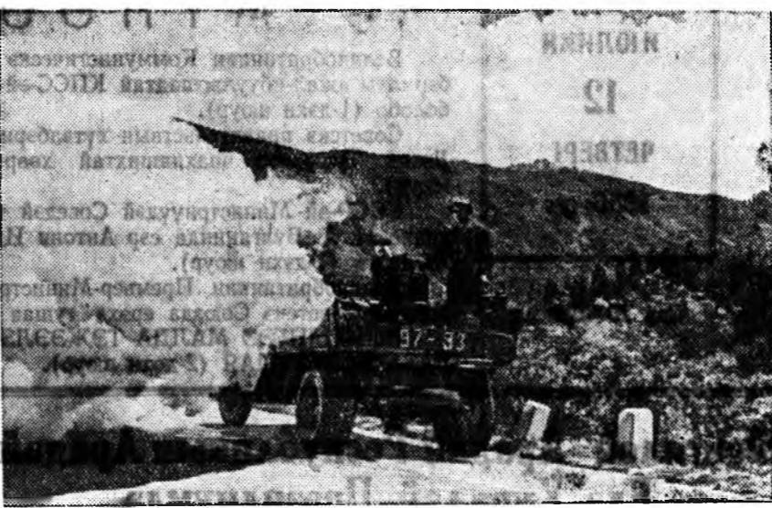
Казахска ССР. Хүдөө ажарын хоротонтой тэмсэхэ Алма-Атинска отряд Заилийска Ала-Тату гэжэ хадаундай боорихдоо 500 гектар колхозой салдууды, хоёр мянга шахуу гектар хаарын аялоншье хоротоншоо хамтаалба.

Жэсээнь, һү худалдалгаһа хээээ, хэды шэнээн зөөри орхоо байнаб гэжэ бүхалтеридэ мэдээжэ байдаг.