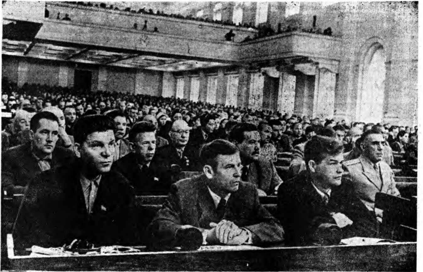
Москва, СССР-эй Верховно Советэй дүрбэдэхэ зарлалай табадахы сесся. ЗУРАГ ДЭЭРЭ: заседанин зал соо.

СССР-эй Верховно Советэй та-бадахы сесся июлин 14-дэ Крем-левско-Ехэ Ордон соо хүдэлмэрэ үргэлжлүүлээ.