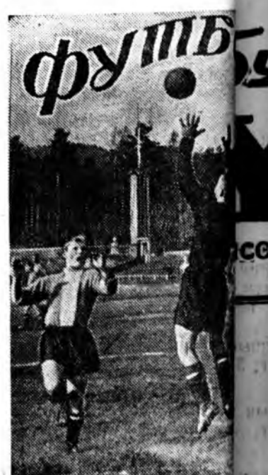
Унгараша амаралтын үдэрэй 25 жалай ойн) нэрэмжэдэ дээрэ манай республикын футбол клубына хизаарай футбол уулаба. Футбоор үзэгшэ Сибирин зонодо түрүү һуур түлөө мурсысөн энэ уулзалга дэргэдэ тулаадан боложо ба...