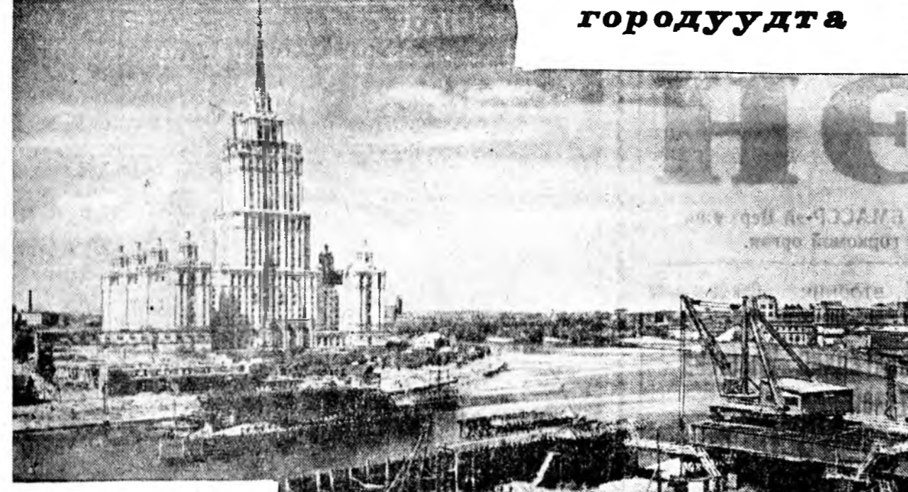
ЗУРАГ ДЭЭРЭ: Москва мүнэн дээгүүр гараха Ново-арбатска хүүргын барилга дээрэ.