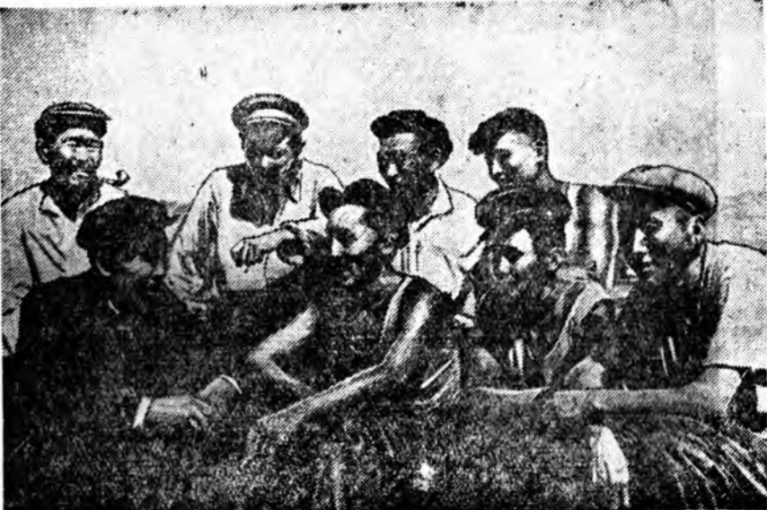
Бударын аймагай Ждановой нэрэмжэтэ колхозой барилгын бригада эмхи-хэгдхэн сагнаа хойшо малай типовой байрануудые олоор барихаа гадна, куль-турно-ажалуудай хэдэ хэдэн барилгануудые бүтээгээ.