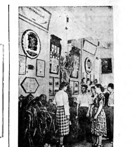
Алтайн хизаар. Барнаудта хизаарай хүдөө ажахын выставкэ нээгдэ. Мүнөө жэлдэ Алтай гүрэндөө 300 миллион нүүд гэхэ гү, али недондойхидо орхоодо гурба хахад дахин ехэ тариа тушааха юм. Гансахан «Комсомольский» гэжэ шэнь газарай совхоз нэгэ миллион 250 мянган нүүдлээ бага бэшэ ороһоо тарья тушааха байна.

Хэмжэнгын аймагай Хрущевой нэрэмжэтэ колхоз хээрын элдэб ногоогоор 300 тонно силос дарахаар хараһан байна. Энэ силос хуряадаг 1 комбайн, гурбан автомашина (нэгэнниинь прицептэй) хүдэлмэрилнэ. Мүнөө эндэ 80 тонно силос дарагдаба.