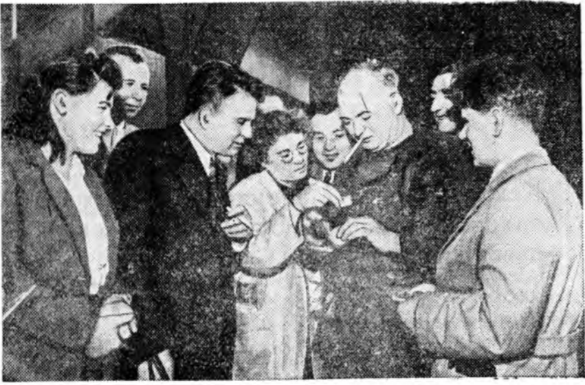
Энэ жэлд советскэ олон туристнууд «Победа» гэжэ теплоходоор Европые тойрон аяншалхан байна. Туристнууд Болгари, Греци, Итали, Франци, Голланди болон Шведидэ хүрэн байна. Мүнөө «Победа» гэжэ теплоходоор үшөө нэгэ бүлэг туристнууд аяншалгада гаранхай. ЗУРАГ ДЭЭРЭ: Гаврта бүлэг туристнууд портдох докернуудай нэгэнтэй хоёралдажэ байна.