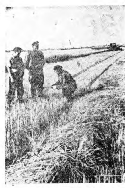
Алтайн хизаар, Алтайн урда жажы нүхэр хүдэлмэрилэгшэд энэ жэлдэ 300 миллион пүүд орооно гүрэндэ тушааха уялга абанхай. Егорьевско районий Сталиний нэрэмжэтэ колхоз гектар бүриөө 120 пүүд хабарай шониса хуряана. Энэ жэлдэ колхоз гүрэндэ нөгэ миллион пүүд тарья тушааха юм.

Гектар бүриөөн 10—15 центнер тарьяан гарахаар тухайлбаритай. Иимэ хайн ургасатай тарьяа гээнгүй хуряага гэжэ ехэтэ оролдожо байнабди. «Сталинец-6» комбайны хадагдан тарья хуряахаар тааруулан түхэрээб. Мэхинны солоомооноын аминдань суглуулажа хаядаг түхэрэлтэ энээндэ байһан юм. Тээд солоомые нагшуургаар зөөхэдэ мэхиннэ тэрэндэ оронгүй, газараар үргидөөд, гээгдэшэдэг хэн. Тэрэниие болуулхын тулада солоомын транспортеры доонон табихаданмай солоом мэхиннэтээ хамта гараха болгодоо. Мэхиннэ гээшэ малда ехэ үнэтэ тэжээл ха юм.