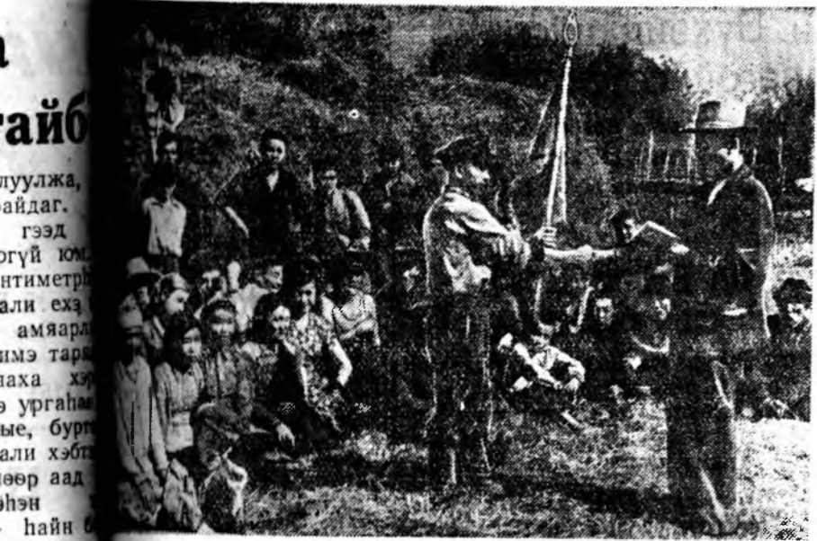
Сандановий хүртэлбариад тэжээл бэлдэхэд эвэно Задын аймагт «Коммунар» сорого түүрүүлж, правлений, парторганизацийн дамжуулагч тугта хүртэлхэй. Энэ эвэнобхид үдэр бүри 3 хүри табиха байдаг.