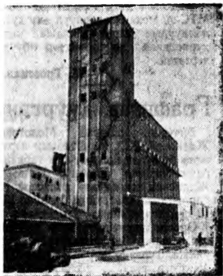
Зетонскэ ССР. Зетони дотороо агзон томо Таллинскэ элеваторай түрүүшын өөлжөөн баригдажа дүүрбэ. Энэ элеватор тарья сөбөрлэдэг хүсэ ехэтэй шэнэ агрегатуудаар хангагданхай. Час соо 8 тонно тарья хатаадаг сушилка, сүүдхэдээ 85 тонно тарья татадаг тээрма энэ бии.