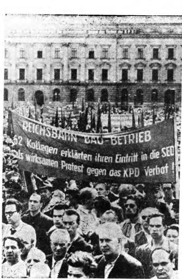
Германска Демократическа Республика. Немецкэ столицын хоёр хубин 200 мянган ажалшад хабалгалтай митинг Берлинде, Август Бебелин нэрэмжэтэ талмай дээрэ болоо. Берлинэй арад зон Баруун Германидахи арадай демократическа эрхэ сүлөөе даралгада эхээр эсэргүүсэжэ байханаа мэдүүлэн бундестагта хандаһан байна. Берлинэй олон тоо ажалшад лозунгуудые бариха, талмайда гараха зуураа Баруун Германида КПГ-е хоршондонь эсэргүүсэн, Германиин Социалистическэ Нэгдэмэл партида орохо байханаа мэдүүлэбэ. ЗУРАГ ДЭЭРЭ: Берлинэй түмэрэмшад митингдэ хабалгалта байна. Лозунг дээрэн итгэжэ бэшэ: «Түмэр замуудые барилгын гүрэнэй предриятин 62 худалдарилашад КПГ-е хоршондонь эсэргүүсэн КПГ-дэ орохо байхан тухайгаа мэдүүлэбэ».

ССР Союзнаа Иранда байгаа Худалдаа наймаанай түлөөлэгш газар, Иранай Худалдаа наймаанай министрство буд, модо, рис ба бусад эд товарнуудые бүри эхээр худалдахада, тэршэлэн эрхим найн шанартай Иранай сай худалдахада тулалха ёнотой гэжэ хэлсэбэ.