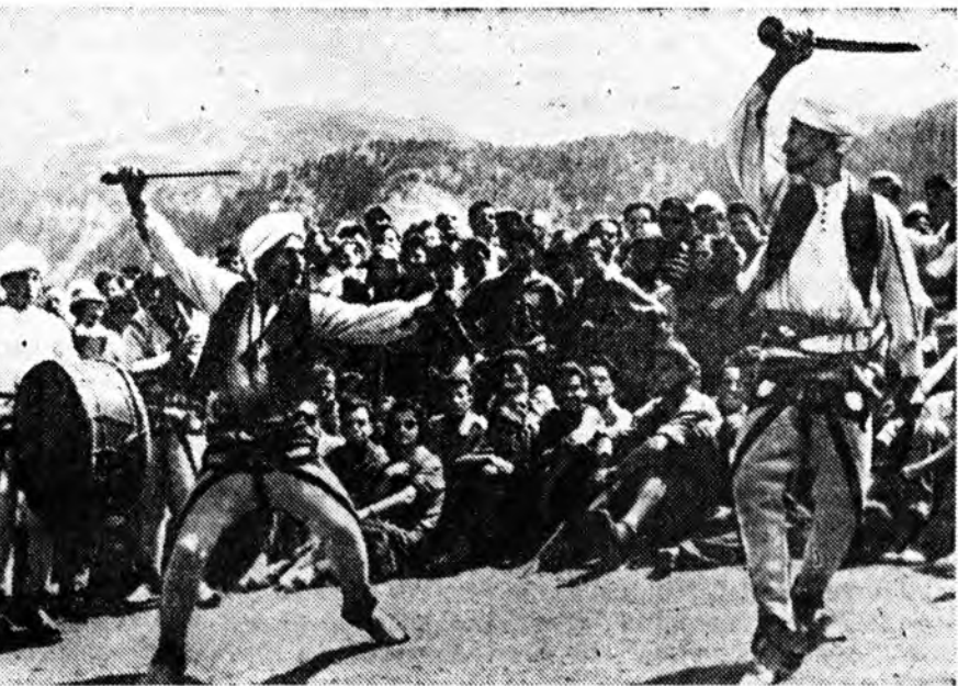
Югославиин Федеративна Арадай Республика. Няхан Сербини «Проклетие» гэжэ халануудта югославска алынистүүдтэ заншалта һайндартоо сугларба. Тэрэндэ 4 мянга шахуу спортменүүд хабааллаа. ЗУРАГ ДЭЭРЭ: Алынистүүдтэй һайндартаа. Нутагай хууриин зоной түлөөлөгшэд арадай танца наадажа байна.