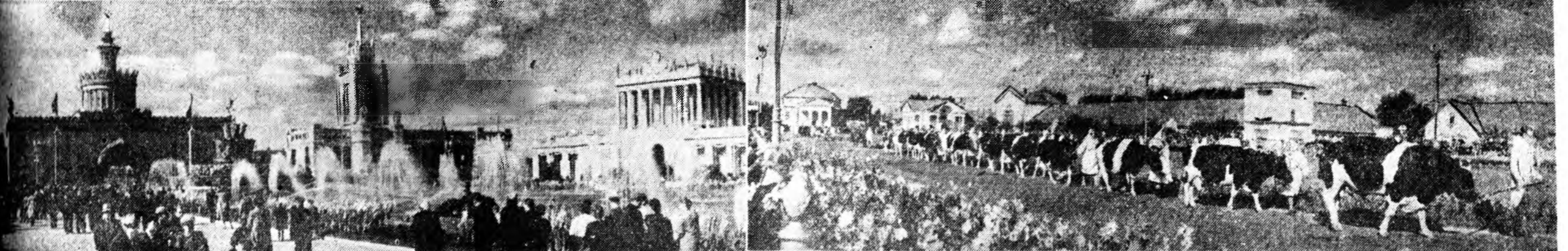
ЗУРАГ ДЭЭРЭ: эбэртэ бодо малые выставкэ дээрэ харуулжа байна.