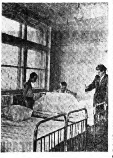
Москва, Москворецка районий 12-дох һургуулиин интернат соо. ЗУРАГ ДЭЭРЭ: уналтын нэгэ табар харуулагдана.

Ханын газетэ, «дайшалкы хуудан», «молин» үгы. Газетэнүүдэй дээрэ дээрэнээ арбаадаараа ерэхэдэнь хүнүүд уншажа үрднэшьегүй. Энэ олон коммунистууд, комсомолениууд хүдэлдэг. (Text continues with farm reports)