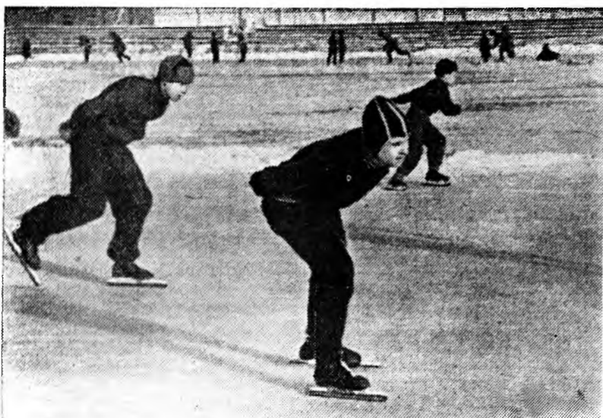
ЗУРАГ ДЭЭРЭ: амаралтын үеэр суурь дээр.