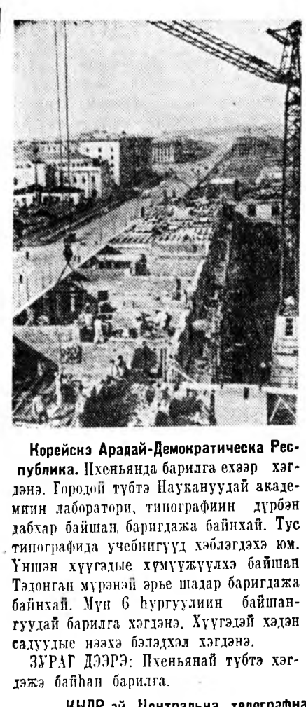
Корейскэ Арадай-Демократическа Республика Икхеньянда барилга эхээр хэгдэнэ. Городой түбтэ Наукануудай академин лаборатори, типографин дүрбэн дахар байһан барилдажа байһахй. Тус типографидэ үчөингүүд хэблэгдэхэ юм. Үнээн хүүгэдые хүүмүүхэхэ байһал Тадонган мүнэной арше шадар барилдажа байһахй. Мүн 6 һургуулин байһангуудай барилга хэгдэнэ. Хүүгэдэй хэдэн садудые нээхэ бэлдэхал хэгдэнэ.

Хас-хасан сохибо ха. Хашхарха абаа дуулаад, Хаанай һамган эрбэн. Хаалан сагаан модон Хааннэ хатантайн сохижо. Хаана унаа мүүрүүлбэ, Хама амын булгалба. Хашхарха ёлохые дуулаад, Хаанай сэрэг эрбэ, Хаантайн, һамгантайн, сэрэгтэйн Хайра гамгүй сохижо, Ами һанандань удангүй, Аюул ушаруулха болоходонь, Хаан дүрбэн хүлээжэ, Хайра гуйжа хүлээбэ: — Ашата үбгэн, үршөөгт, Ами һаньем аршалт. Буга үнээн хоёртын Бусажа сагтаа үгэхэб,— Гэжэ хаанай хэлэхэдэ, Үбгэнэй сүхал таража, «Улаан модон» гэхэдэнэ, Модоншы сохиохо болибо. Буга үнээн хоёртын Бусажа хаан үгөөд: — Арьоун һуудалдам һуу, Алтан тамгынни бари, Адуу малынын ээмлэ Албата зоним албада,— Гэжэ хаан хэлэбэ ха. — Хан зэргэдэ шунаагүйб, Хара һанаа һанаалаагүйб. Өөрынгөө юмэ абахаб, Хүнэй юмэн хэрэггүй. Хаанда байдаггүй эрдэнэ Хараш хүндэ байдаг юм. Ямбатанда байдаггүй шэди Ядуушы хүндэ олдодог юм,— Гэжэ хаанда хэлээд, Гэлдэгэр бушуул эрбэжэ: һүн эдэгээ билтуулаа,— һүрхэй хүрэгшэ үнэгээ Алта мүнгэ бэлгэдлэг Арьоун найхан бугаяа Арадаа үбгэн хүтлөөд, Гэртэ харяа юм һэн ха.