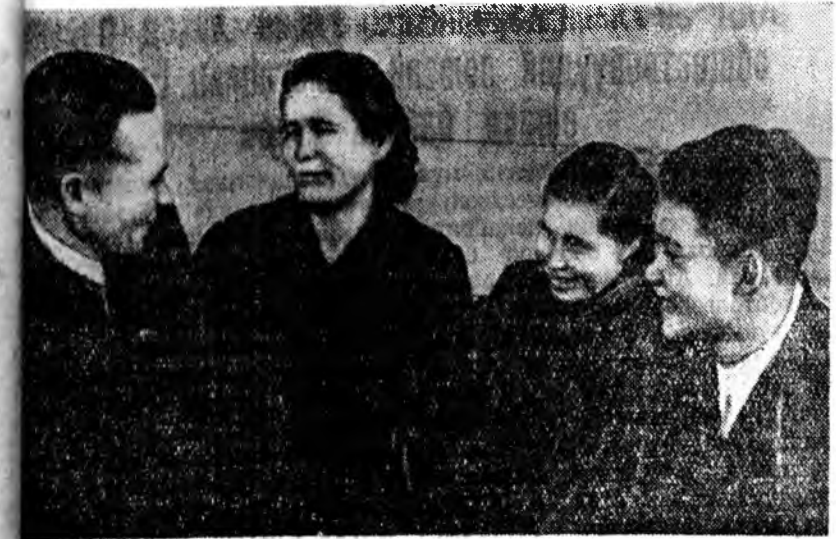
Прибайкальска аймагай Хрущевой нэрэмжэтэ колхоз һу наалтаараа респубика дотороо түрүү нуури ээлтэ. Энэ колхозой наалтада ажахын пәнэ жэлэй р нара соо үнсэн бүрийнө 223 литр һу хаба.