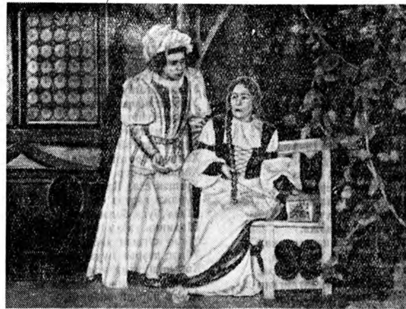
Лениней орденото Бурят-Монголой гүрэнэй оперо ба балетдэй театрын коллектив французска композитор Шарля Гуногой «Фауст» гэжэ опере найруулан табижа. Энэ оперын либретто немецкэ уранзохиолшо Гётын трагедийнэ абтанхай.