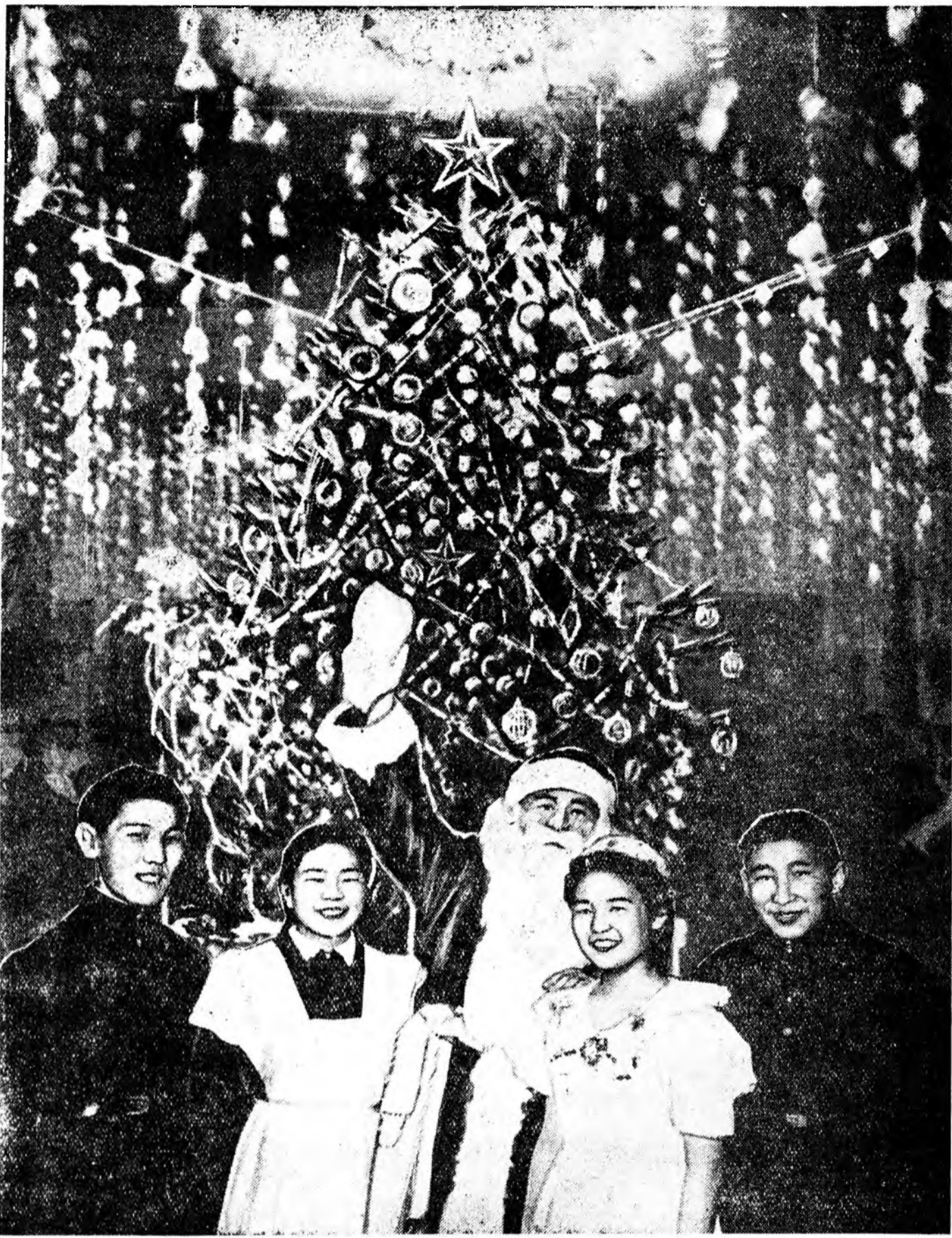
ШЭНЭ ЖЭЛЭЭР, НҮХЭДҮҮД!