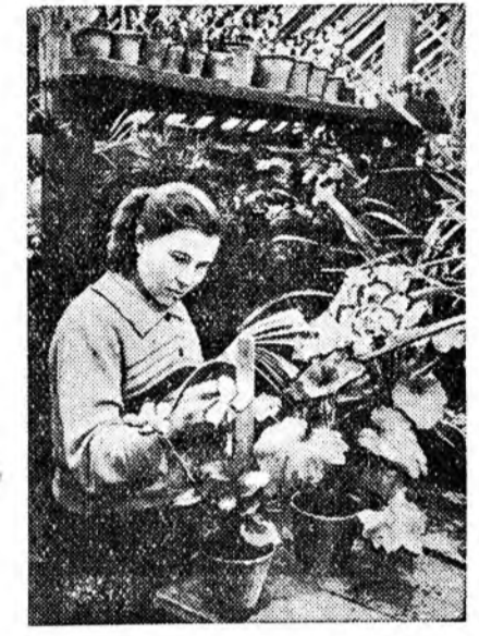
Мурманска область. СССР-эй Наукануудай академин Кольско филиалай полирино-альпийска ботаническа сад Кировск городто бии юм. Эндэ бии болгоһон, хүйтэндэ хүдэлгэгүй ургамалууд Заполяриин городуудта хэрэглэхэ юм.

Тоосоото ба тоосоотонггалтын суглаае колхоз бүхэндэ эмхитэй һайнаар, шүүмжэлэл ба өөргөө шүүмжэлгын оршон байдалда, бүхэ колхознигуудай эдэбхитэй хубаадалгатайгаар үнгэрэхэ гэншэ партиин айкомундай, аймгүйсэдкомундай, МТС-үүдэй, колхозуудай правлени болон партийна эхин организацинуудай шухалын шухала зорилго мүн.