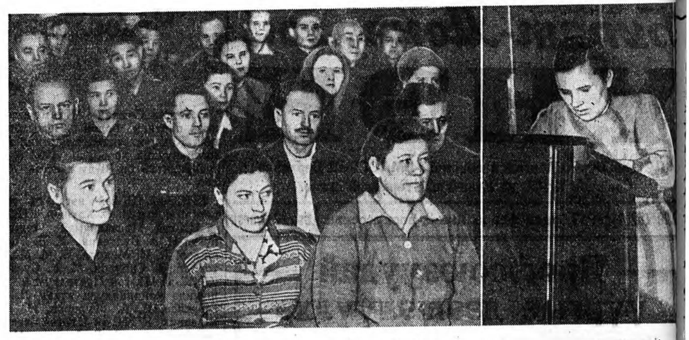
ЗУРАГ ДЭЭРЭ: Улан-Удын гурваной банкын хүдэлмэрилэгшэд ажалшадай депутадудай Городской райной Советдэй депутадта кандидатые дэбжүүлхэ суглаа үнгэргэжэ байна.

Социалистическэ оронуудай нэгэдэһе батдахан бэхжүүлхэдэ, социализм байгуулгын ба бүхэ дэлхэй дээрэ эб найрамдал сахилгын агууехэ хэрэгнэ аршалан хамгаалха ябадал хангана. Энэнай социалистическэ оронуудта эсэргүү империалистическэ ээрхэг туримхэй бүлэгүүдэй һүйлхыһэ ябуулгын улам шангалдагдажа байһан мүнөө үгэдэ шухалын шухала зорилго, бүхэ ахадүү арадуудай интернациональна уялга болонго.