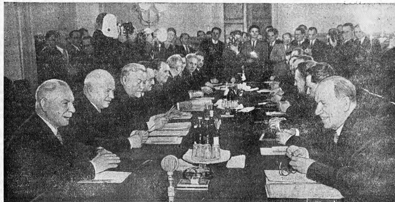
Москва. СССР-эй болон Чехословакин Республикын Правительствона Делегацинуудай хоорондоо январин 26-да Бремен соо хэлсэн ахылаа. ЗУРАГ ДЭЭРЭ: хэлсэн боложо байна.

КПСС-эй ЦК-гэй Нэгэдэхы секретарь Н. ХРУЩЕВ СССР-эй Министруудэй Соведэй Түрүүлэгшэ Н. БУЛГАНИН